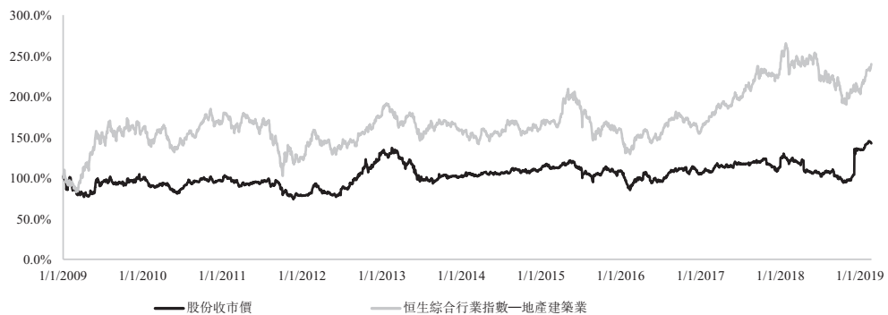
圖2：比較股份價格表現與行業指數

附註：為與註銷價格比較，圖1所示股份價格已按彭博採納之調整方法就非常規現金股息作出調整。