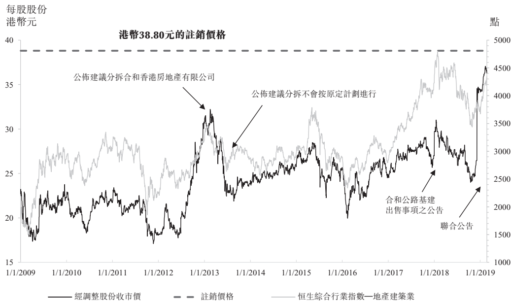
圖1：經調整股份價格及行業指數

下圖載列自二零零九年一月二日起至最後實際可行日期(「回顧期」)，即約十年期間，(i)經調整股份每日收市價及恒生綜合行業指數-地產建築業(「行業指數」)的波動(圖1)；及(ii)比較股份價格表現與行業指數(圖2)：